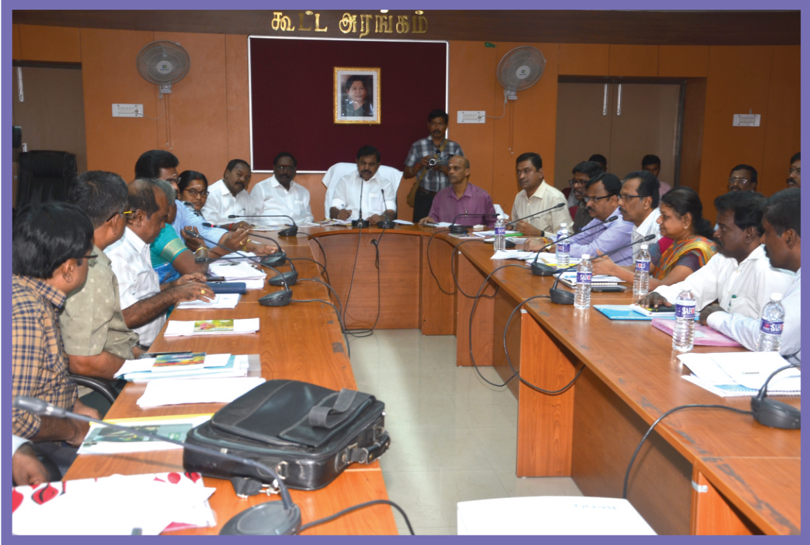
மாண்புமிகு தமிழ்நாடு முதலமைச்சர் திரு.எடப்பாடி K.பழனிசாமி அவர்கள் தலைமையில் சேலம் மாநகராட்சியில் நடைபெற்று வரும் பணிகள் குறித்த ஆய்வுக் கூட்டம்