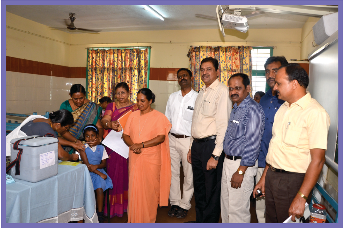
சேலம் மாநகராட்சி பகுதிகளில் நடைபெற்று வரும் தட்டம்மை மற்றும் ரூபெல்லா தடுப்பு சிறப்பு முகாமினை தனி அலுவலர் மற்றும் மாநகராட்சி ஆணையாளர் திரு.க.இரா.செல்வராஜ் அவர்கள் ஆய்வு செய்தார்