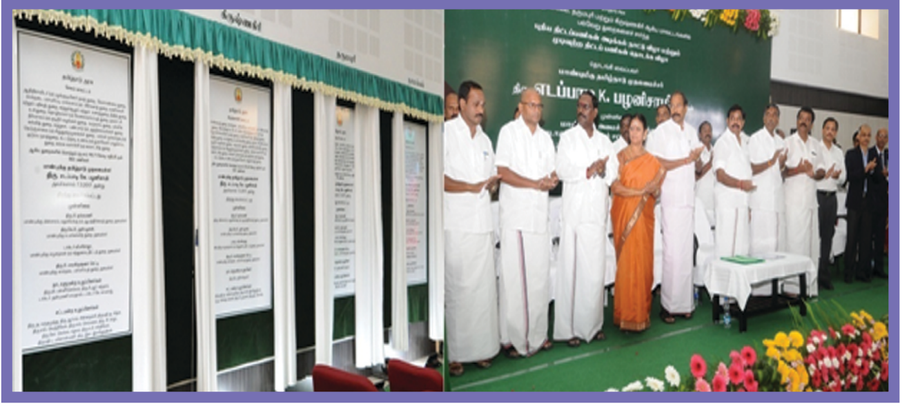
மாண்புமிகு தமிழ்நாடு முதலமைச்சர் திரு.எடப்பாடி K.பழனிசாமி அவர்கள் சேலம் மாநகராட்சி பகுதிகளில் புதிதாக கட்டப்பட்டுள்ள புதிய நகர்புற ஆரம்ப சுகாதார நிலையங்கள் மற்றும் மகப்பேறு மருத்துவமனைகள், வீடற்றோர்களுக்கான இரவு நேர தங்கும் விடுதிகள் மற்றும் சமுதாய கழிப்பிடம் ஆகியவற்றை திறந்து வைத்தார்.